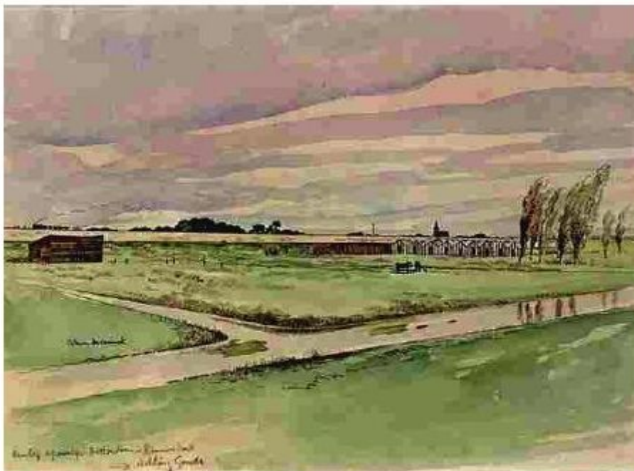
Octave de Coninck, Aanleg spoorlijn Rotterdam-Nieuwerkerk, 1949 (Stadsarchief Rotterdam) met zicht op kassen van Hoofdweg en kerk (NB Op de expositie in de Oudheidkamer de andere uit deze serie)

Open middagen Oudheidkamer (14-17 uur): 1/6, 6/7, 3/8, 7/9, 14/9 (OMD), 5/10, 2/11 en 7/12